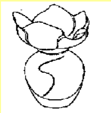
（一）第 1 個視圖