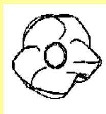
（三）第 3 個視圖